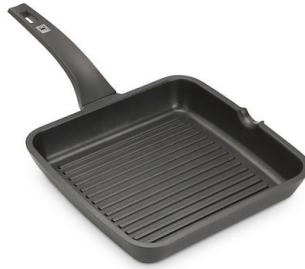
Steakpfanne Induction PRO