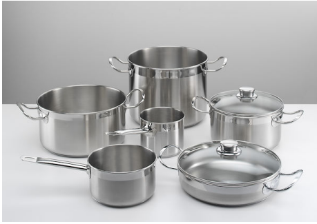
Induktionskochgeschirr PRO, 8- teilig