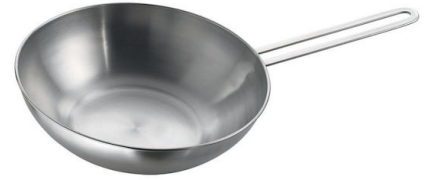
Wokpfanne mit flachem Boden Induction PRO